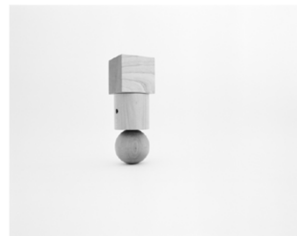
Aurélien Froment, Fröbel Fröbeled , 2013 (détail)