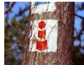
Sur la piste du monument à Fröbel, entre Bad Blankenburg et Keilhau, 2012.